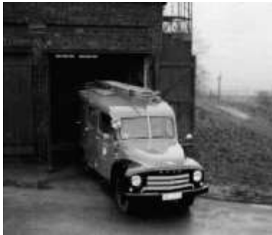
Opel Blitz LF 8-TSA ...

Um 1964, wurde ein neues LF8/TS Faun/Heines beschafft. Was die schlechten Zustände im Gerätehaus, Feuchtigkeit, unbeheizt usw., nicht schafften, wurde dann bei einer Technischen Hilfeleistung vollbracht. Ein Baumstamm musste bewegt werden, dabei bewegte sich auch der Fahrzeugrahmen um immerhin 10cm! Totalschaden