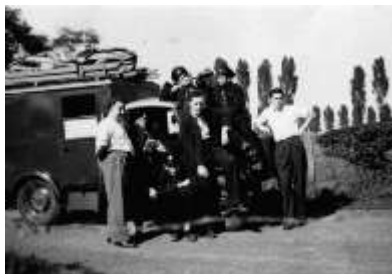
Erstes Löschfahrzeug 1950

Um hier einen besseren Stand zu bekommen, wurde durch die Kameraden ein gebrauchter Leichenwagen beschafft. Das Fahrzeug musste mit eigenen Mitteln Ausgebaut und für seine neue Aufgabe hergerichtet werden. Leider versagten immer wieder Motor, Achsen oder sogar das Getriebe. Nach Monaten an Arbeitszeit wurde das Fahrzeug endlich dem TÜV vorgestellt. Wo es dann auch auf dem Hof verblieb und nie wiedergesehen wurde.