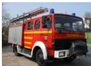
LF 16 -TS

LF16TS Iveco/Magirus , als Nachfolger des 2015 in Ruhestand geschickten LF16TS kam im April 2016 ein baugleiches Fahrzeug, ebenfalls mit dem Bj von 1988, zu unserem Standort. Dieses Fahrzeug wird hauptsächlich für die Jugendfeuerwehr, aber auch für die so genannte Langwegstrecke eingesetzt.